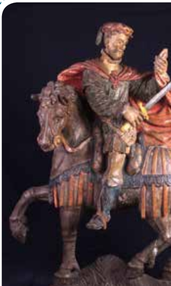
Eglise de Gilocourt - Musée de l'Archerie et du

Soyons témoins de la Miséricorde, à la suite de St Vincent de Paul, S